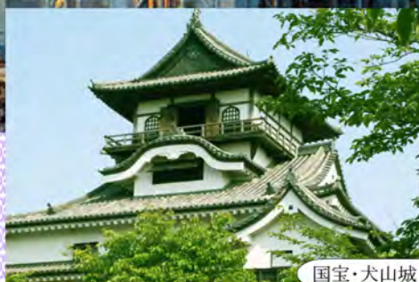
国宝・犬山城と城下町散策