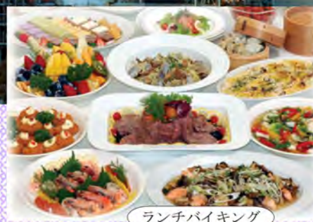
ランチバイキング